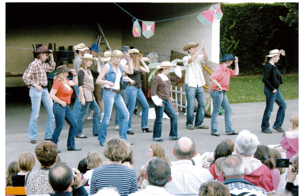
Les animateurs font leur show.