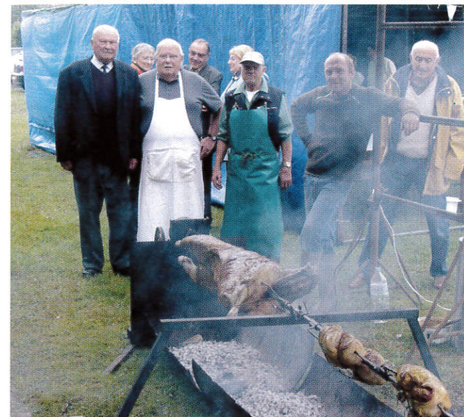
Le méchoui à Fossemanant