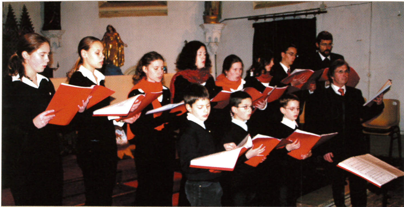
Les petits Baladins

La bonne acoustique de notre église attire de plus en plus de formations musicales.