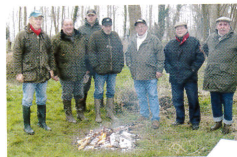
Réconfort autour d'une flambée