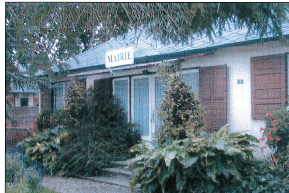
Le local faisant fonction de Mairie de 1977 à 2005.