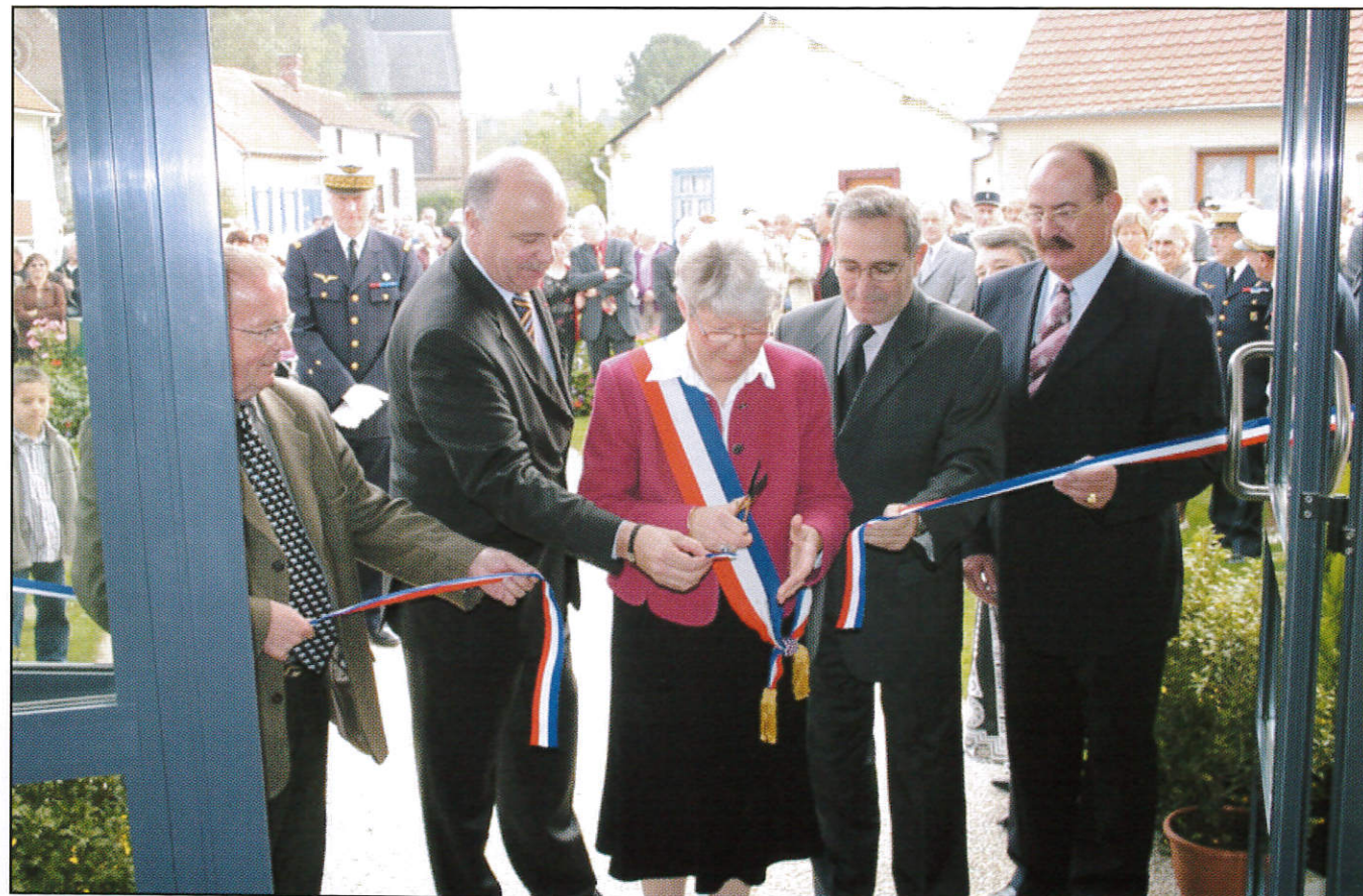
Le ruban est coupé, on va pouvoir entrer...