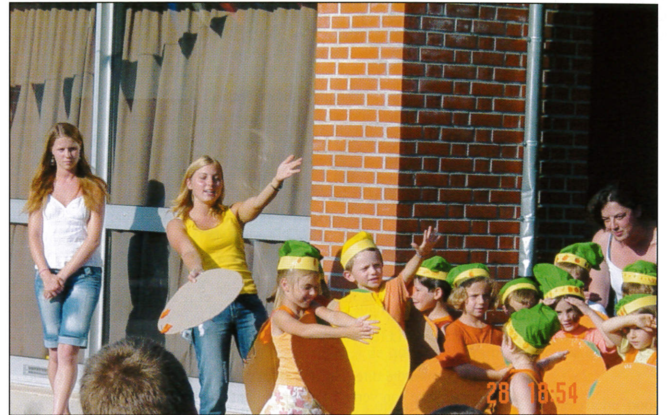
La fête du Centre de Loisirs.