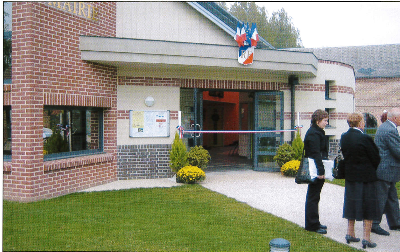
Le ruban non coupé : tout est prêt !