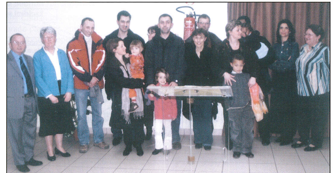
La cérémonie des Vœux.