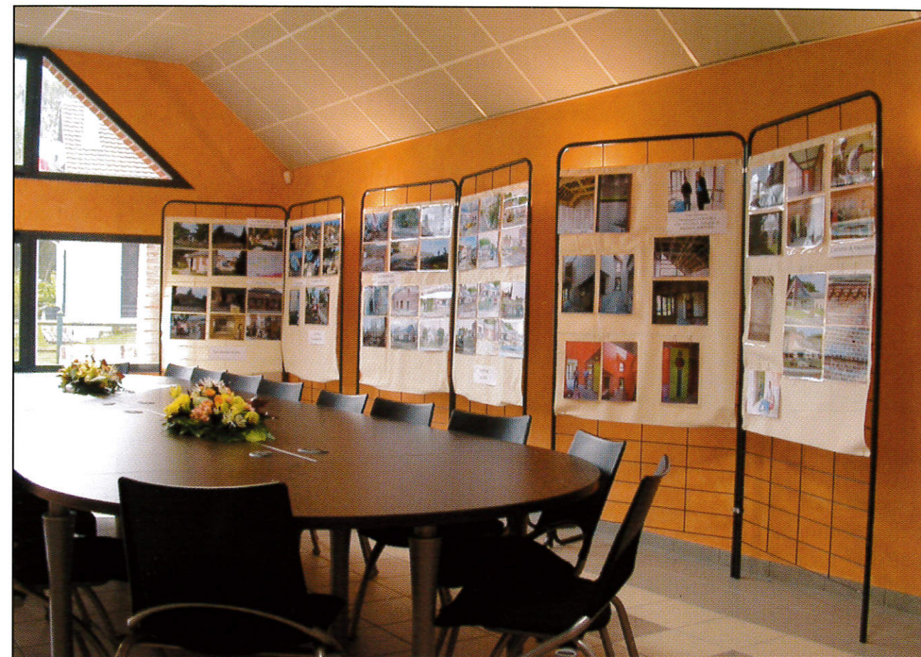
La salle du Conseil : l'exposition photos des travaux.