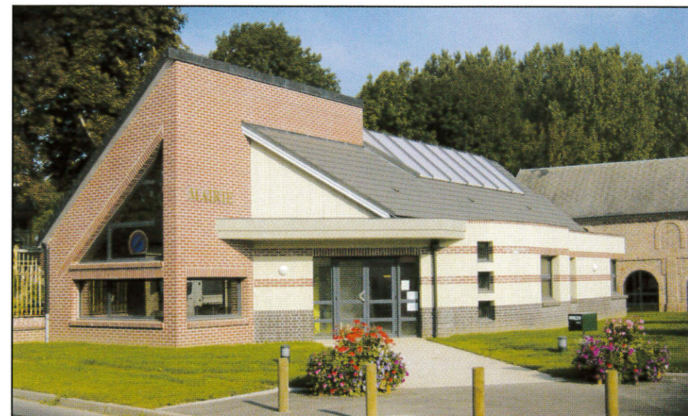
La nouvelle Mairie : Été 2006