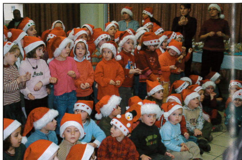
Le Marché de Noël des enfants.

Inscrits : 179 Votants : 64 Bulletins blancs ou nuls : 4 Suffrages exprimés : 60 A obtenu : liste Gamard : 40 voix Attribution des sièges : liste Gamard : 5 sièges Sont déclarés élus : Titulaires : Mesdames Gamard, Berthier, Devauchelle, Levy, Monsieur Maison Suppléants : Mesdames Bellard, Villemont