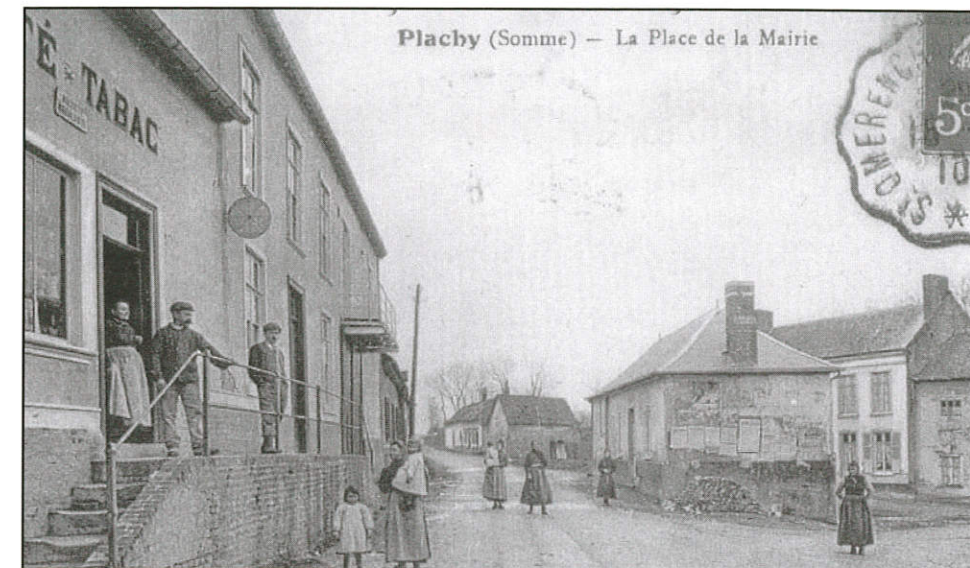
La Mairie du 18 ème siècle à 1959.