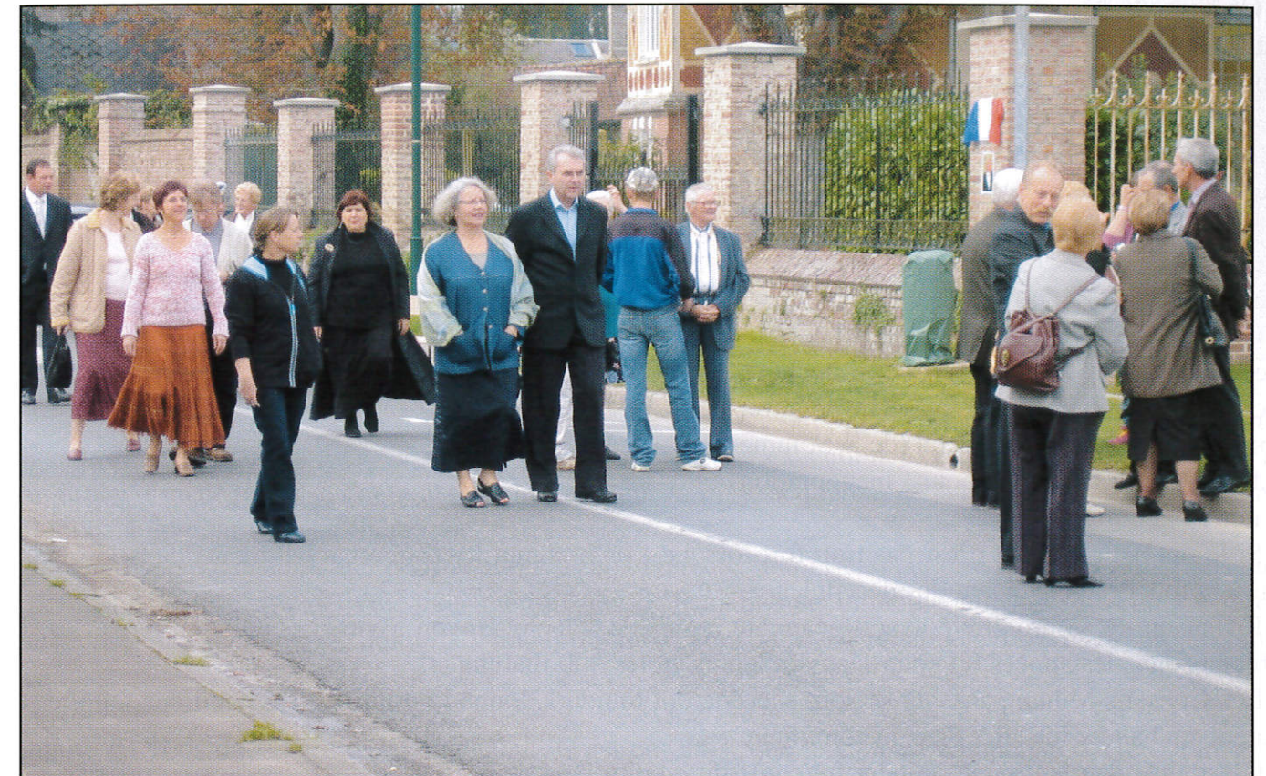
L'arrivée des invités.