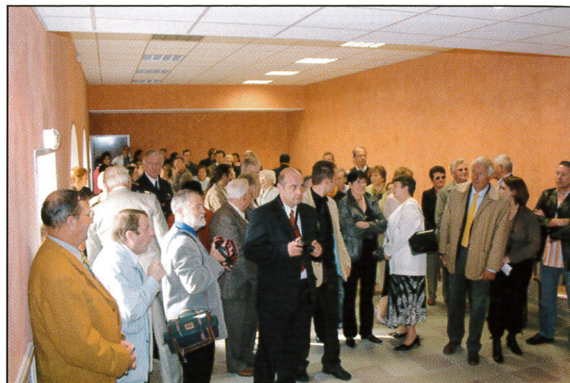
En attendant les discours dans la salle d'honneur.

En feuilletant les archives, dont beaucoup furent détruites pendant l'Occupation, on apprend que cette mairie abritait en 1820, la classe qui regroupait 80 élèves. Ceux-ci moins favorisés que leurs descendants étudiaient l'Histoire de France et à défaut de pupitres apprenaient à lire sur leurs genoux.