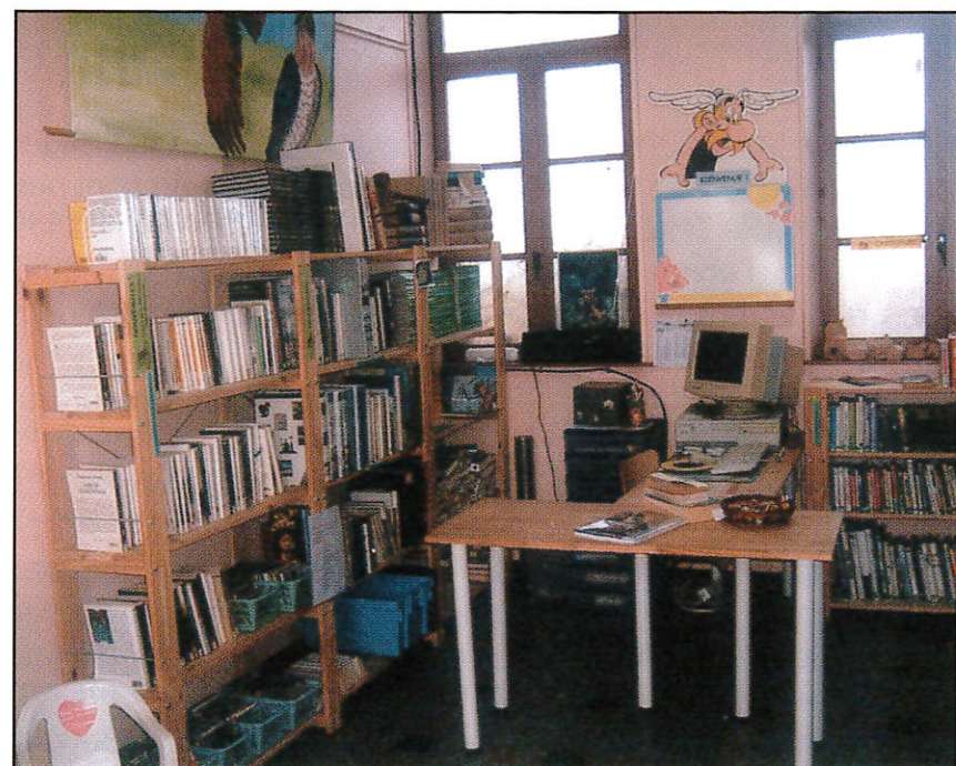
La bibliothèque, rue de la Fontaine.