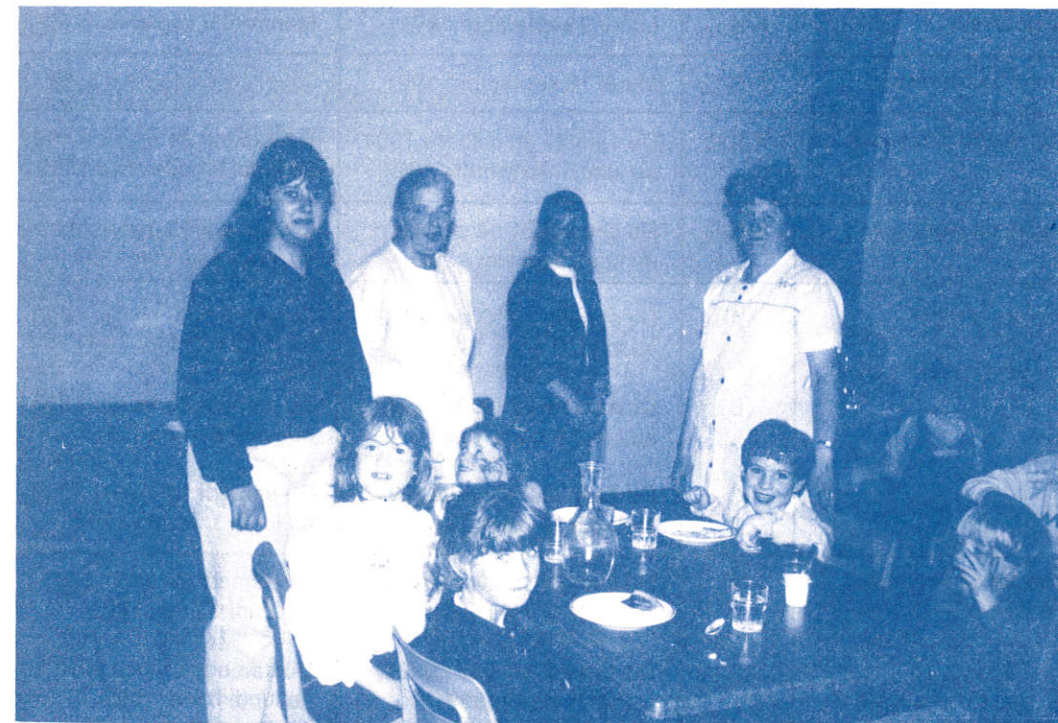
Organisation pédagogique à la rentrée scolaire 1991/92.

Tout au long de l'année scolaire, les élèves du CM1, CM2 ont participé avec d'autres écoles de l'Amiénois à l'écriture d'un livre jeu dont vous êtes le héros "Haute voltige pour une marionnette" le livre leur sera remis officiellement le jeudi 27 Juin 1991 à Riverly. Ce jour là le fond d'aide à l'innovation leur offrira un goûter et un séance de marionnettes avec «Che Cabotans». Vous aurez l'occasion de le lire à partir de cette date.