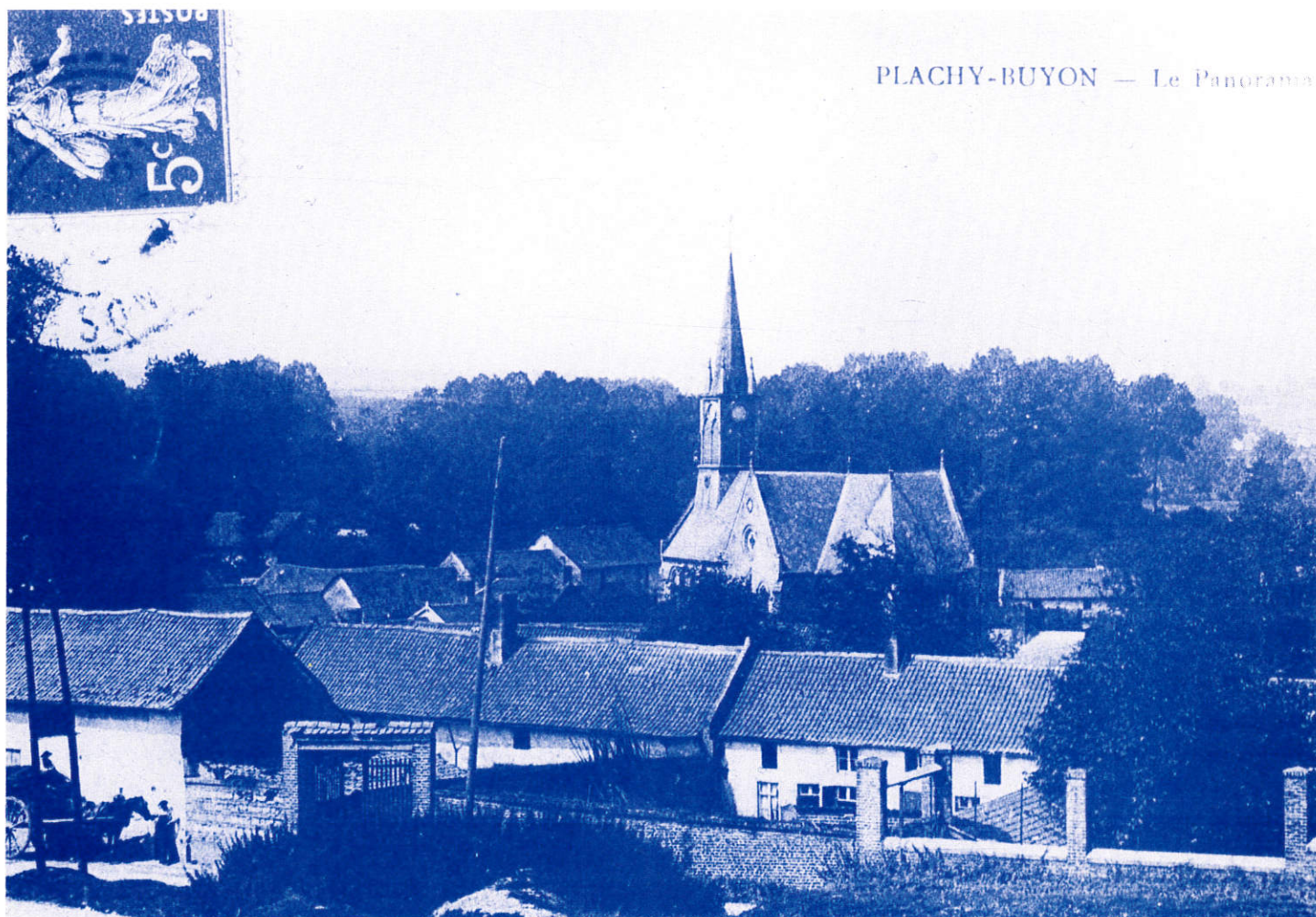
PLACHY-BUYON — Le Panorama